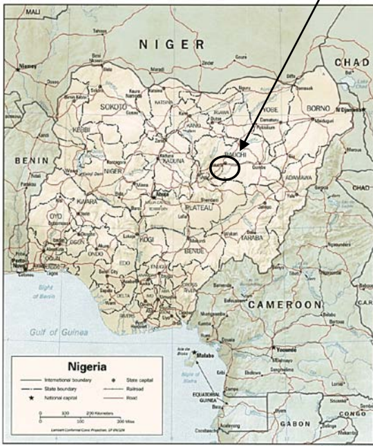
1 : Nigéria : Les langues SBW

Résumé : Le système pronominal proto-tchadique occidental reconstitué par Newman & Schuh montre une opposition singulier/pluriel fondée essentiellement sur le contraste vocalique dans une forme CV. La variation du timbre ayant été abandonnée au profit de la voyelle centrale /ə/, les langues Sud-Bauchi Occidentales (SBW) ont dû trouver une solution pour rétablir l'opposition singulier/pluriel. Après une rapide présentation de la famille SBW l'exposé présentera, à partir d'un exemple fourni par la 2ème personne de l'Aoriste, les différentes solutions choisies par 12 des 27 langues que comporte ce groupe, ainsi que les conséquences que cela implique pour la pluralité verbale en SBW.